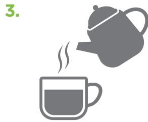
Mélangé avec de l'eau chaude