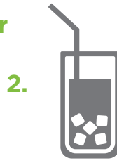
Versé sur de la glace