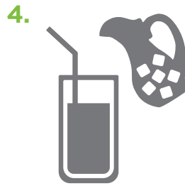
Dilué avec de l'eau froide